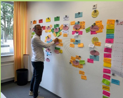
Themenclustering im Oktober/November 2022